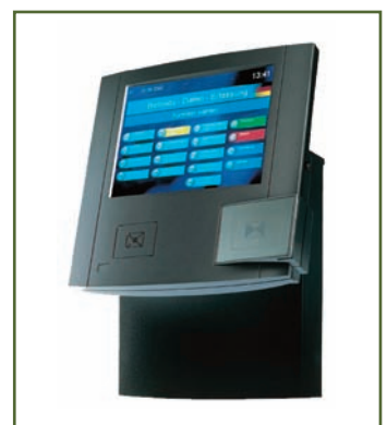
Kaba BDE-Terminal B-Net 95 80

www.adicom.com info@adicom.com Fon: +49 (0)62 01 80 80 00